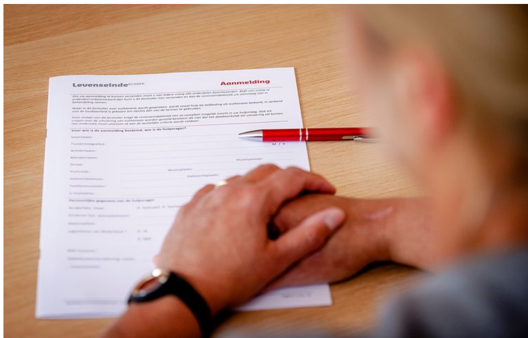
Aanmeldings-formulier van De Levensindekliniek.

De euthanasiecijfers vertoonden vorig jaar een opvallende dip, blijkt uit het jaarverslag van de euthanasiecommissies. Hoe komt dat?