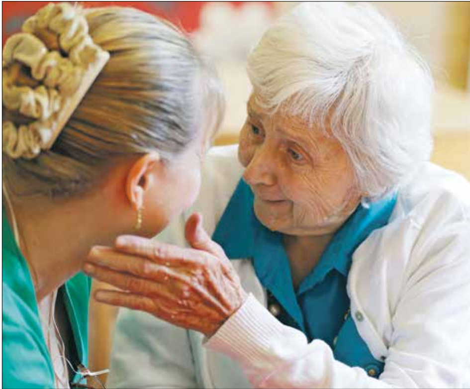
Mensen die in de wereld ogenschijnlijk niets kunnen doen, kunnen daarentegen heel wat "zijn".