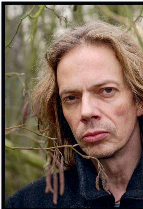
Hugo Claus (auteur) † 19 maart 2008 Euthanasie