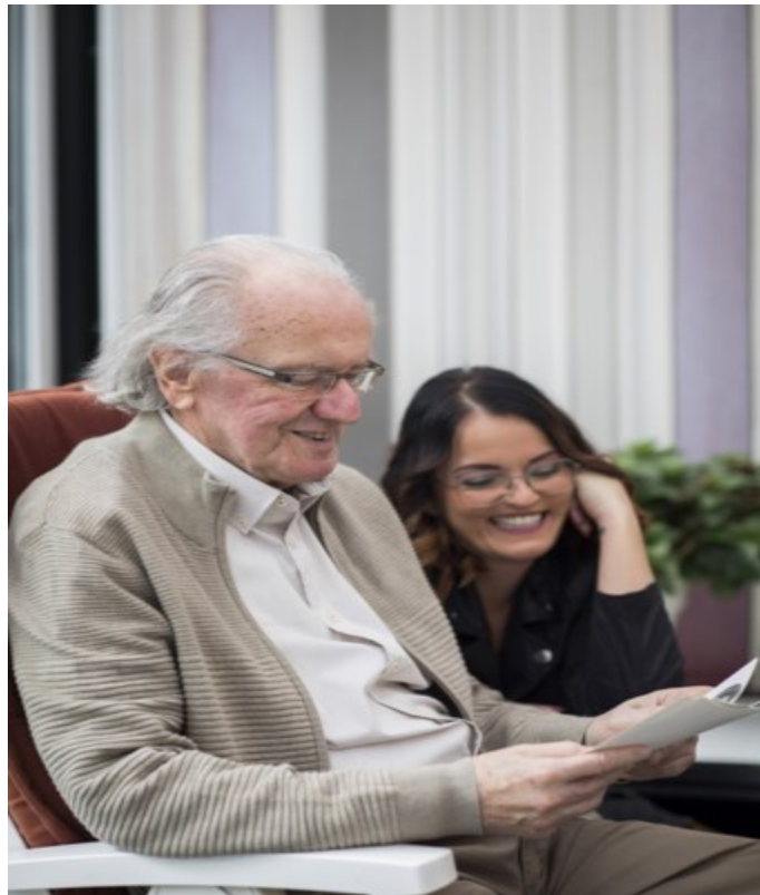
Samen foto's bekijken.

Barbara vond het “een privilege” te weten wanneer haar vader zou sterven. Ze konden nog alles vertellen wat ze wilden vertellen, alles vragen wat ze wilden vragen, samen de begrafenis overlopen. Een bevriende fotografe vereeuwigde die laatste intieme momenten. Tegelijk was het confronterend. “Bijvoorbeeld toen we fotoalbums van reizen doorbladerden en hij de vakantieherinneringen erbij vertelde. F*ck, dacht ik, jij bent nog zo helder van geest, en over acht dagen – onrespectvol gezegd – geven ze je een spuitje. ”