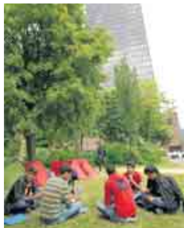
Kamperende asielzoekers.

Het Wit-Gele Kruis Vlaanderen heeft 540 vacatures voor verpleegkundigen openstaan. Naast de vergrijzing, is de korte verblijfsduur in het ziekenhuis een belangrijke oorzaak. Veel meer mensen vallen na een operatie terug op thuisverpleging. De zorgvragen worden ook complexer. Zo heeft iemand met een gebroken heup specifieke verzorging nodig. (belga)