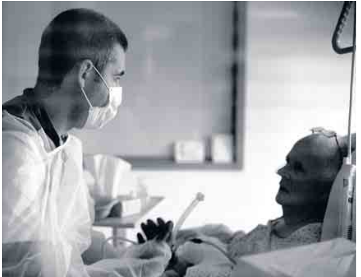
Verpleegkundigen horen vaak als eerste de vraag naar euthanasie.

het om een kort en intens proces gaat, van gemiddeld drie tot vijf dagen. Het gaat immers om zwaar zieke patiënten, die meestal al een tijdje achteruit zijn gegaan. De verpleegkundigen zelf vonden