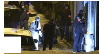
Politie massaal aanwezig in Verviers