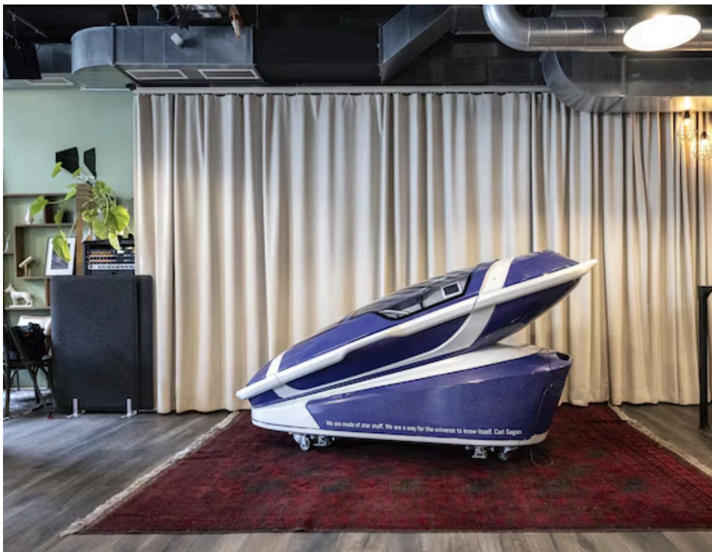
De 'zelfdodingscapsule' Sarco, waarmee als eerste persoon ter wereld een 64-jarige Amerikaanse vrouw overleed.

Niet zonder reden koos de eerste gebruiker van 'zelfdodingscapsule' Sarco voor Zwitserland als locatie: het laatste decennium reisden meer dan 1.300 buitenlanders naar het land voor een vrijwillig levenseinde. Toch arresteerde de politie meerdere personen op verdenking van betrokkenheid bij zelfdoding. Vier vragen over de Zwitserse euthanasiepraktijk.