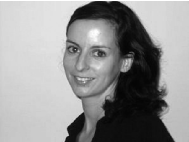
An Ravelingien.

weten beter.' Overigens staat een acute depressie (bv. door een rouwproces) de wettelijke voorwaarde van vrijwilligheid meestal in de weg. Het gaat bij het merendeel van de euthanasie-aanvragen om andere mentale aandoeningen, soms in combinatie met langdurige, chronische en therapieresistente depressie.