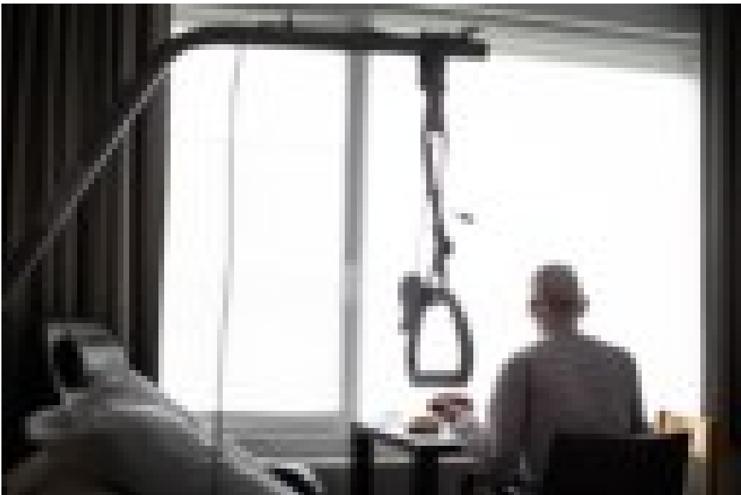
Een hospicekamer in Sint-Vincentius Avelgem.

In het wzc Sint-Vincentius in Avelgem is de dood geen taboe, ook euthanasie niet. Voor terminale zestigplussers die liever niet thuis sterven, zijn er zelfs twee aparte kamers. ‘Dat met hun wensen rekening zal worden gehouden, stelt hen gerust.’